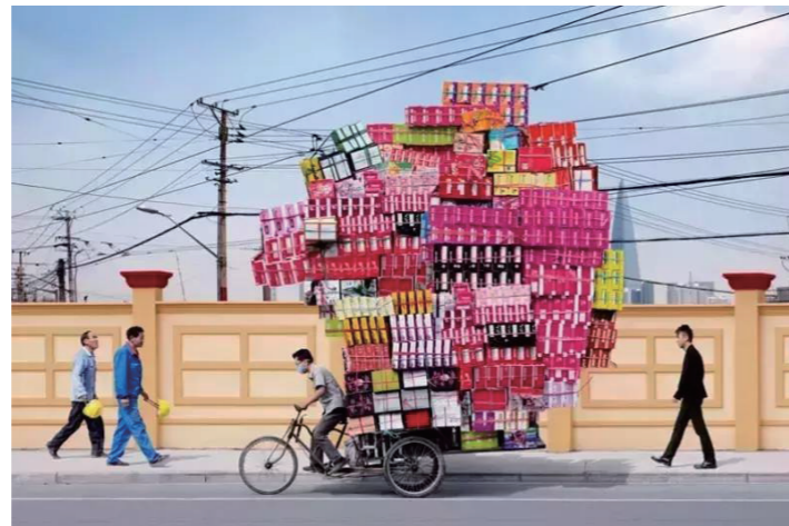
註：写真はブラックかつ自虐的なジョークを含んでいます。実際にこのような流通、運搬を行っている訳ではありません…（笑）

宣伝活動においても文化が違う中国人の気持ちに届く言葉や画像、映像を用いて商品情報を広く伝える表現を持っております。