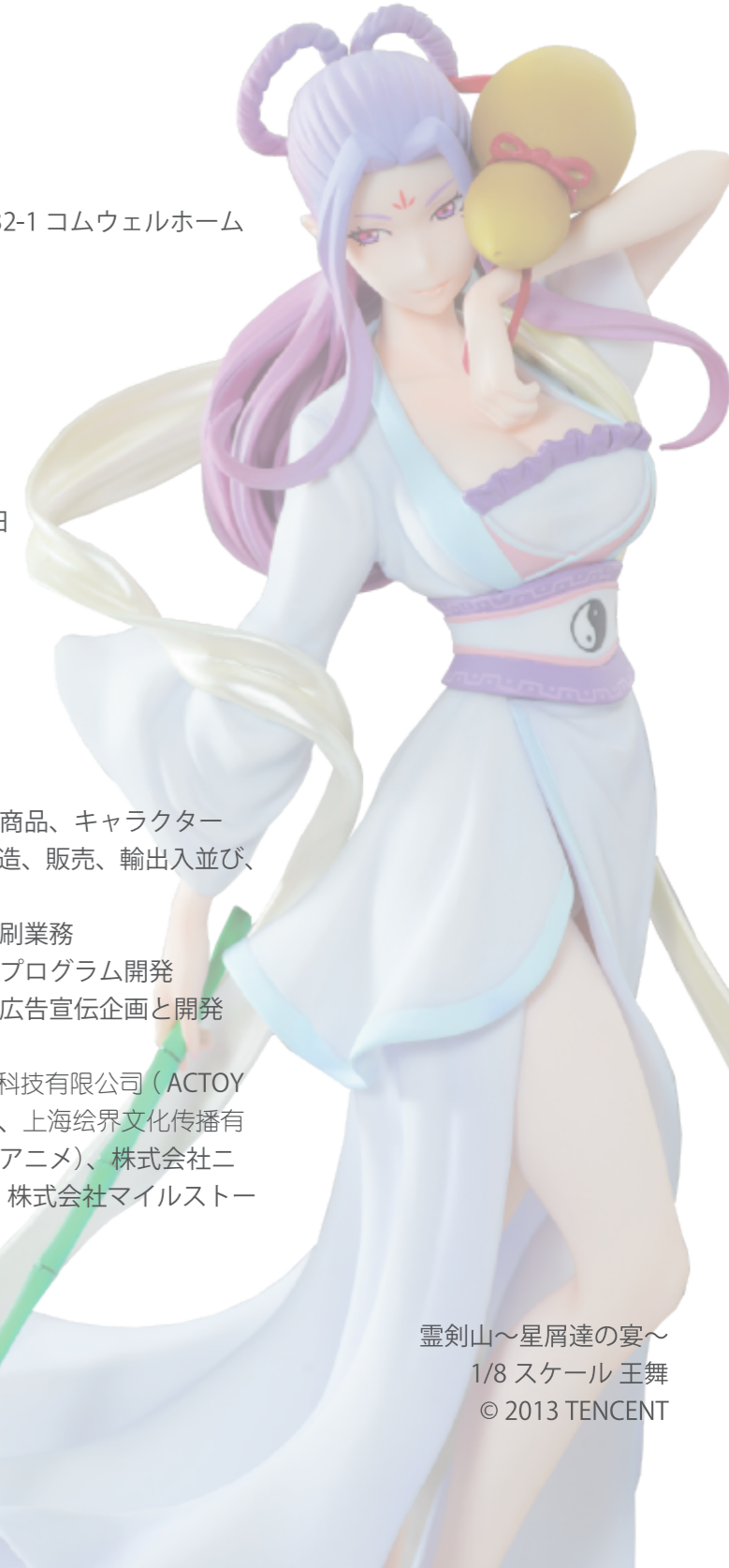
霊剣山～星屑達の宴～ 1/8スケール 王舞 © 2013 TENCENT

主要取引先 絵夢株式会社、济南亿福莱网络科技有限公司（ACTOYS.net）、株式会社ガイナックス、上海绘界文化传播有限公司、腾讯公司（テンセントアニメ）、株式会社ニトロプラス、株式会社ビリビリ、株式会社マイルストーン、マベル有限会社